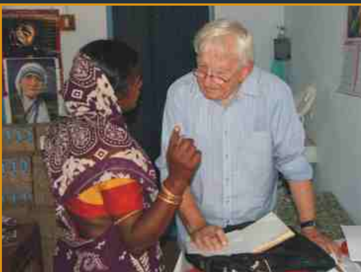
W szkole Beatrix, podczas rozmowy z matką jednego z uczniów