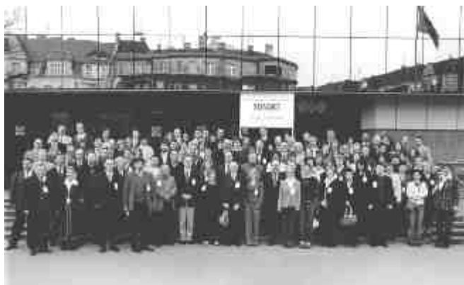
W konferencji udział wzięło 220 uczestników z 15 krajów