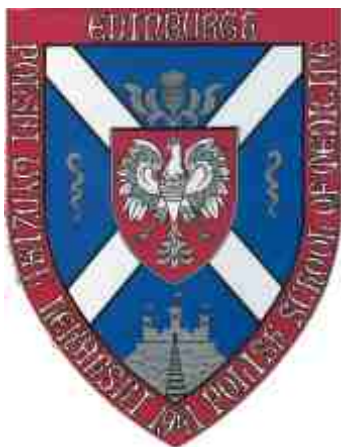
Logo Polskiego Wydziału Lekarskiego w Edynburgu