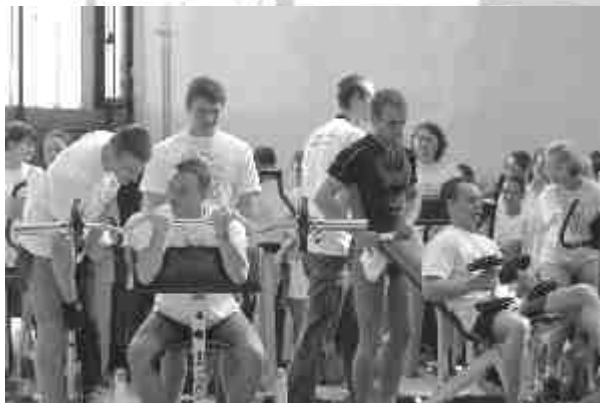
Podczas Dnia Sportu zaprezentowały się wszystkie sekcje sportowe działające w poznańskiej Akademii Medycznej

Dzień rektorski w środku maja może oznaczać tylko jedno – Dzień Sportu. Tym razem odbył się on razem z imprezą Medykalia-Open Air , na której wspólnie bawili się studenci poznańskiej Akademii Medycznej i Uniwersytetu Adama Mickiewicza w Poznaniu. Wszystkie sekcje sportowe naszej Uczelni miały możliwość zaprezentowania swoich osiągnięć i zachęcenia do wstępowania w ich szeregi.