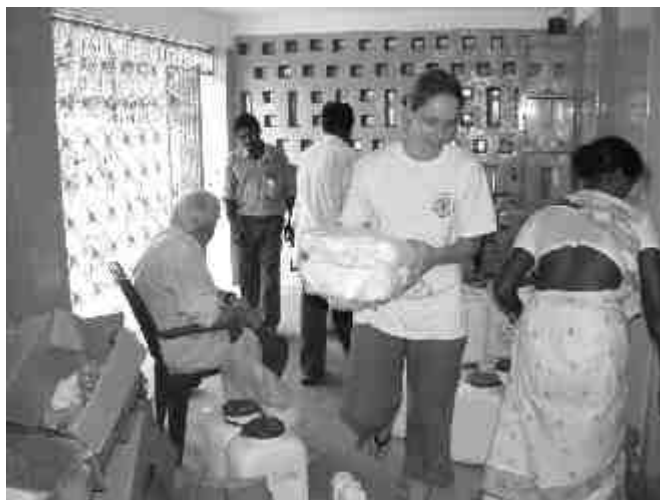
Magazyn z lekami w Przychodni Trędowatych w Puri, odnowiony i wyposażony przez Fundację Pomoc z Polski w kwietniu 2006 roku