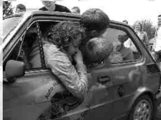
Ile osób może wejść do „malucha”? Studenci udowodnili, że trzynaście